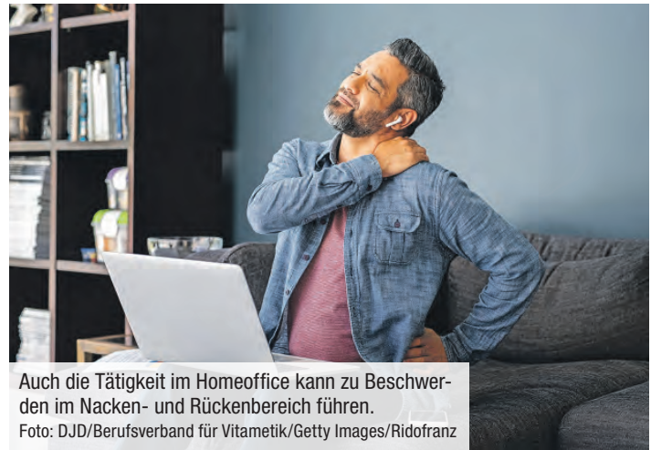
Auch die Tätigkeit im Homeoffice kann zu Beschwerden im Nacken- und Rückenbereich führen.

(DJD). Auch nach dem vorläufigen Ende der Pandemiemaßnahmen werden viele Menschen weiterhin zumindest teilweise im Homeoffice arbeiten. Einer aktuellen Forsa-Umfrage der Krankenkasse KKH zufolge stehen zwar 60 Prozent derjenigen, die schon einmal dort gearbeitet haben, dieser Beschäftigungsform überwiegend positiv gegenüber. Die Schattenseite: Unter allen Befragten, die von negativen gesundheitlichen Effekten berichteten, kämpft ein Drittel im Homeoffice mit verstärkten oder erstmals aufgetretenen Rückenschmerzen und Muskelverspannungen. Und jedem fünften Berufstätigen im Homeoffice schlägt laut Umfrage die Situation auf die Seele. Solche Beschwerden, deren Ursachen im körperlichen oder im psychischen Bereich liegen, können schnell chronisch werden. Entsprechend groß ist der Bedarf an Prävention und Behandlung von Rückenleiden, hier bietet der Gesundheitsmarkt besondere berufliche Chancen. Eine Nische ist etwa die noch junge Tätigkeit als Vitametikerin oder als Vitametiker.