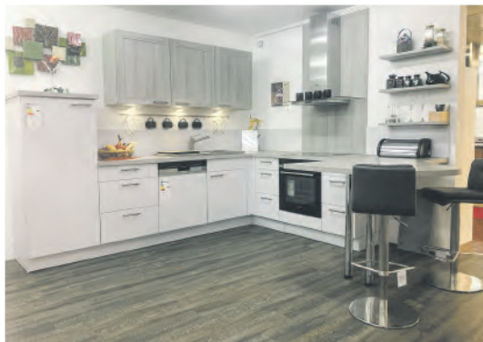
L-Küche „Lichtgrau mit Esche Molina grau“ Maße: 305 x 315 cm