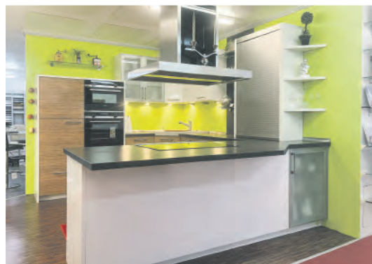
U-Küche „Zebrano Resopal mit Weiß Hochglanz“ inkl. Silgranit-Eckspülen- modul mit Armatur Maße: 265 x 355 x 259,5 cm