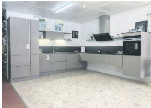
L-Küche „Magma Edelmatt“ Maße: 355 x 365 cm