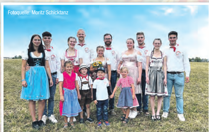
Fotoquelle: Moritz Schick Tanz