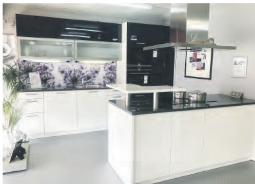
2-Zeilen Küche „Weiß Hochglanz mit Nachtblau“ inkl. Granitarbeitsplatten und Spüle flächenbündig Maße: 325 x 60 cm & 205 x 80 cm