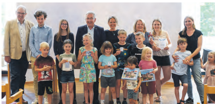
Erster Bürgermeister Kurt Krömer (Mitte) zusammen mit den Sponsoren und glücklichen Gewinnern. Text & Foto: Stadt Stein

Vinyl & Designböden sowie Türen finden Sie in großer Auswahl in unserer Ausstellung