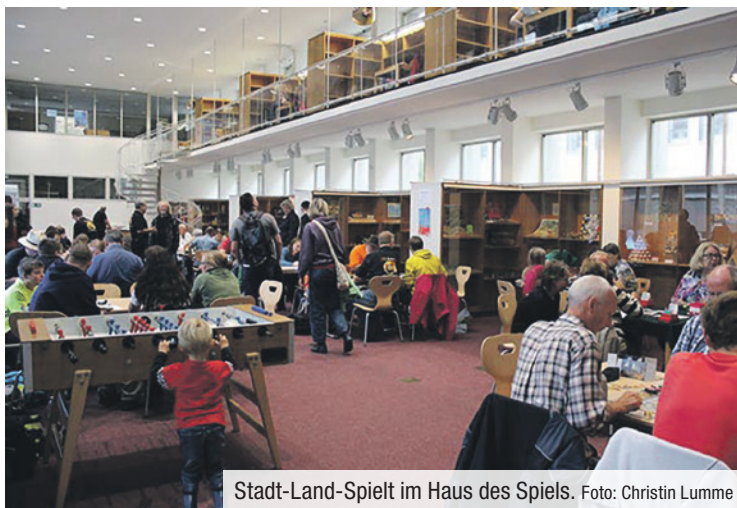
Stadt-Land-Spielt im Haus des Spiels.

Es ist wieder Zeit für „Stadt-Land-Spielt!“: Bereits zum zwölften Mal wird ein Wochenende lang deutschlandweit und darüber hinaus das gemeinsame Spielen für alle in Schulen, Büchereien, Ludotheken, Spielwarengeschäften, Brettspielclubs oder Vereinsheimen zelebriert – und das mit einem neuen Rekord von 320 Spielstätten in Deutschland, Österreich und der Schweiz sowie in den deutschsprachigen Teilen von Belgien, Dänemark und Polen. Das Haus des Spiels und das Deutsche Spielearchiv Nürnberg laden zusammen mit ihren Partnervereinen am Samstag, 14. September, von 14 bis 23 Uhr und am Sonntag, 15. September 2024, von 14 bis 18 Uhr ins Pellerhaus, Egidienplatz 23, ein, um dort das Gesellschaftsspiel und das Kulturgut Spiel zu feiern.